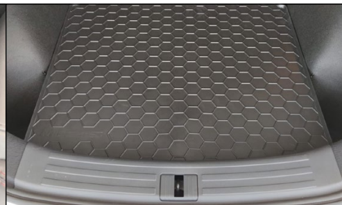
Ochranná vana do kufru